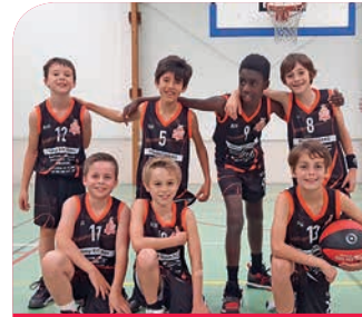
Une des 2 équipes U11G. Les garçons sont bien là !

Le projet débutera 2021 et se poursuivra sur plusieurs tranches en 2022 et 2023.