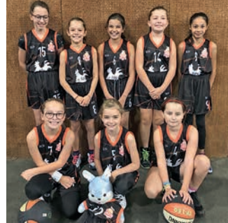
Une des 4 équipes U11F. La mascotte n'a pas été oubliée !