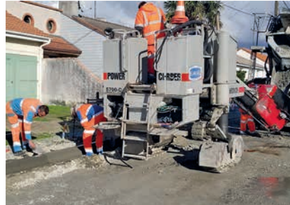
Création des bordures de trottoirs

Après quelques aléas, souvent fréquents lors de réhabilitation, la rue des Garennes s'est refait une beauté, pour une circulation apaisée des voitures mais aussi des piétons et des vélos avec la création de 2 pistes cyclables. Quelques plantations et un aménagement de stationnement à proximité de la pharmacie, complètent et mettent en valeur cette entrée sud du bourg. Encore merci aux riverains pour leur patience et compréhension durant ces 9 mois de travaux.