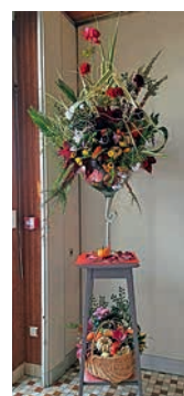
Repas des Aînés - Composition réalisée par Annick Vinet

breuses nouveautés artisanales et commerciales sur notre commune.